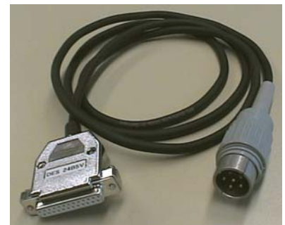
Abb.1 Ansicht Wandlerkabel

Der Betriebsstrom für das Wandlerkabel wird direkt aus der Schnittstelle bezogen. Somit wird keine zusätzliche Spannungsquelle wie Batterie oder Netzteil benötigt.